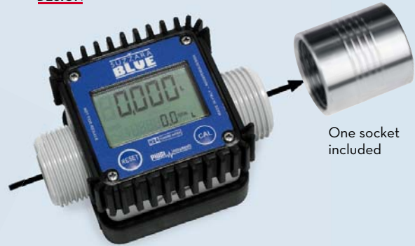
One socket included