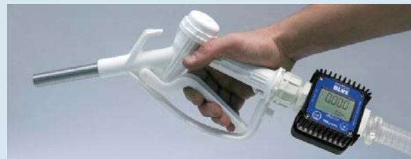
Manual nozzle with K24